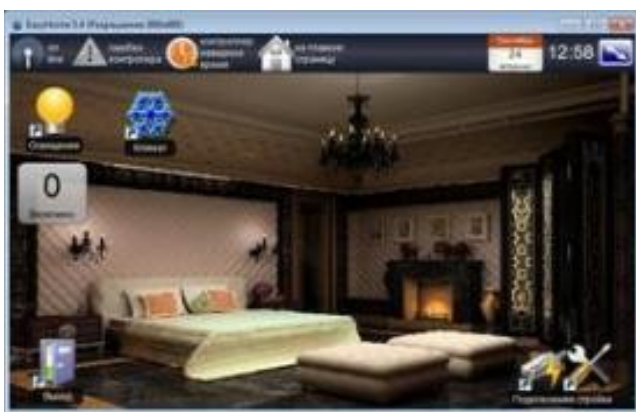
Изображение 1 — Интерфейс программы «EasyHome»

EasyHome — управление умным домом с iOS, Android, Windows.